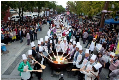
○ 한바탕 비빔퍼포먼스