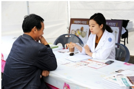
○ 영양사 상담