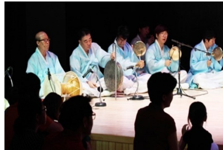
○ 국립무형유산원 행사