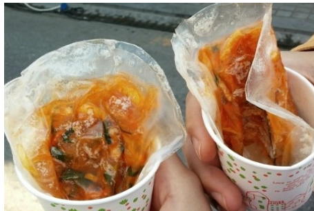
비빔밥 Take-out 메뉴