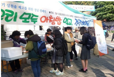
○ 식생활개선 캠페인