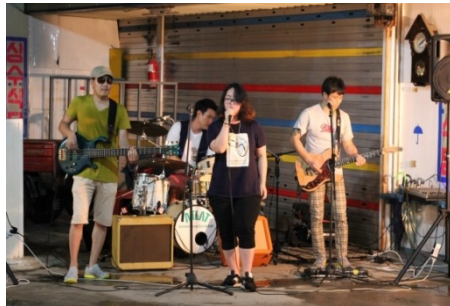
○ 남부시장 공연