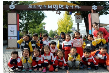
○ 비빔포토존 아취