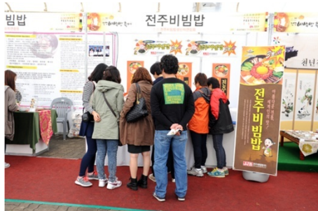
○ 전주비빔밥 홍보관