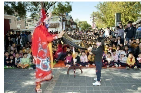
○ 어린이 특별공연