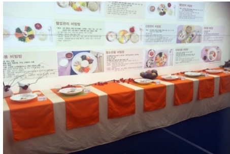
○ 건강한 비빔밥 전시