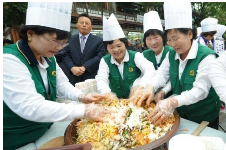
○ 우리동네맛자랑 비빔퍼포먼스