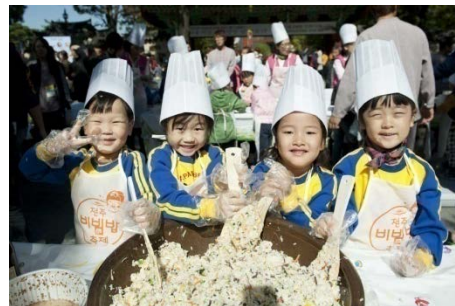
○ 용기종기 비빔퍼포먼스